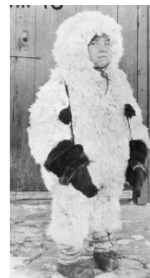
NWT Archives/F. Jackson/N-1979-004: 0088