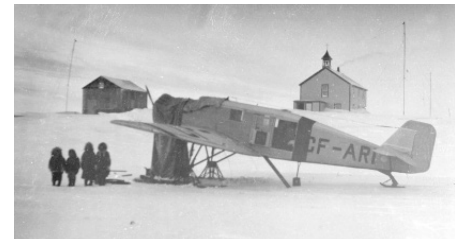
NWT Archives/Edm. Air Museum/N-1979-003: 0293